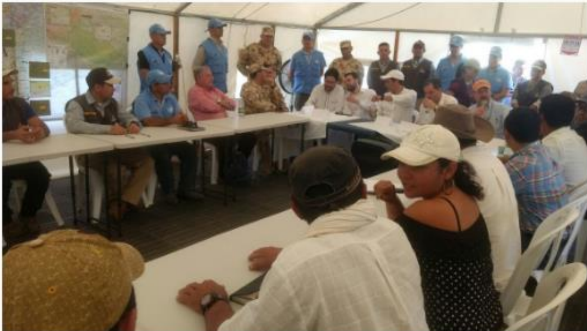
Subcomisión del Senado de Seguimiento y acompañamiento al Acuerdo de Paz, realizó verificación en La Macarena (Meta)

** http://docs.google.com/viewerng/viewer?url=http://190.26.211.101:81/proyectos/images/documentos/Fast+Track/Proyecto+de+Ley/PL+FT+04-17+INNOVACION+AGROPECUARIA.pdf